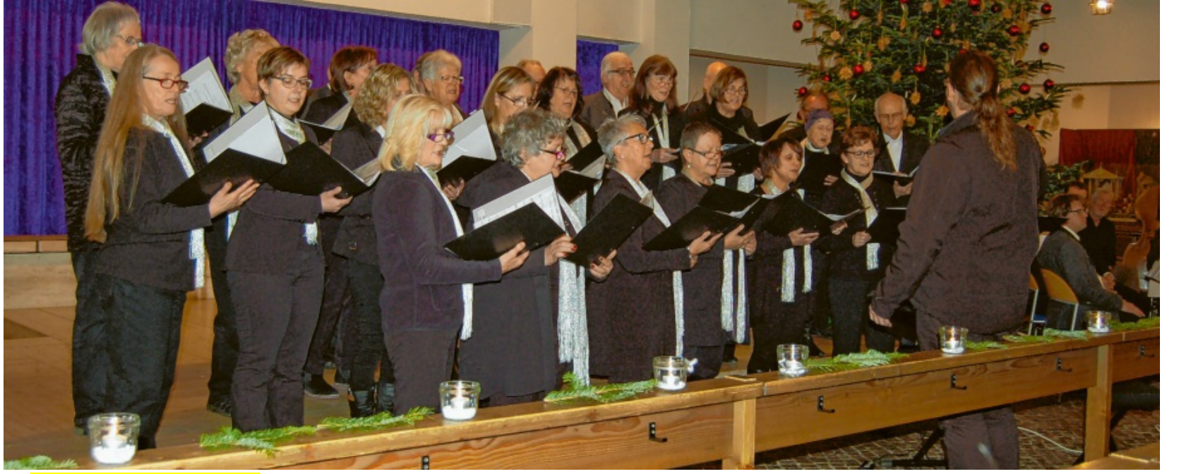
Die Chorgemeinschaft Dinkelscherben beim Konzert in der Sempertkirche.