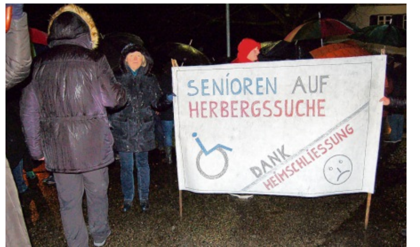
Demobanner vor der Sempert-Kirche bei strömendem Regen.