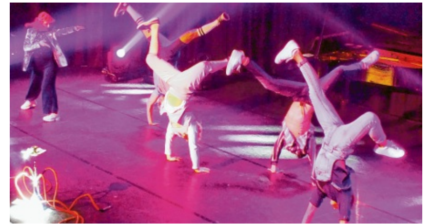
Typische Breakdance-Figur: Hände auf dem Bühnenboden, die Beine in der Luft. Für solche Formationen gab es donnernden Applaus.

Und wie schön kann ein Saxofon-Solo klingen, wenn der Solist bei der Arie „Reich mir die Hand mein Leben“ aus der Oper „Don Giovanni“ seiner Improvisationslust freien Lauf lässt? Kleine Clownerien gehörten genauso zum Programm wie Soloauftritte der Tänzer. Es saß jede Bewegung, jedes Rotieren auf dem Kopf, jeder Sprung. Ganz wesentlich ist die Synchronisation der Bewegungen zur strahlenden Musik Mozarts. Mit der Sinfonie Nr. 41 in C-Dur, auch die „Jupiter-Sinfonie“ genannt, endete eine fulminante Vorstellung. Die Zuschauer waren hingerissen, jubelten, klatschten mit. Eine Minute nach Beginn wurde aus dem Stimmungsfunkeln im Saal ein Feuer der Begeisterung, das bis zum Schluss anhält.