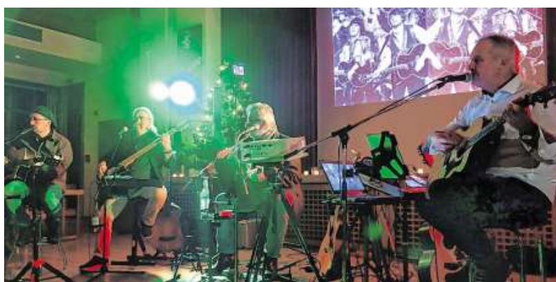
Stimmungsvoll und gegen Ende tatsächlich auch ein bisschen weihnachtlich war der Auftritt von December Project in Hopfen.

Schlagzeuger Smuty Brückner musste aus gesundheitlichen Gründen dem Konzert fern bleiben. Er nahm aber im Vorfeld seinen Part