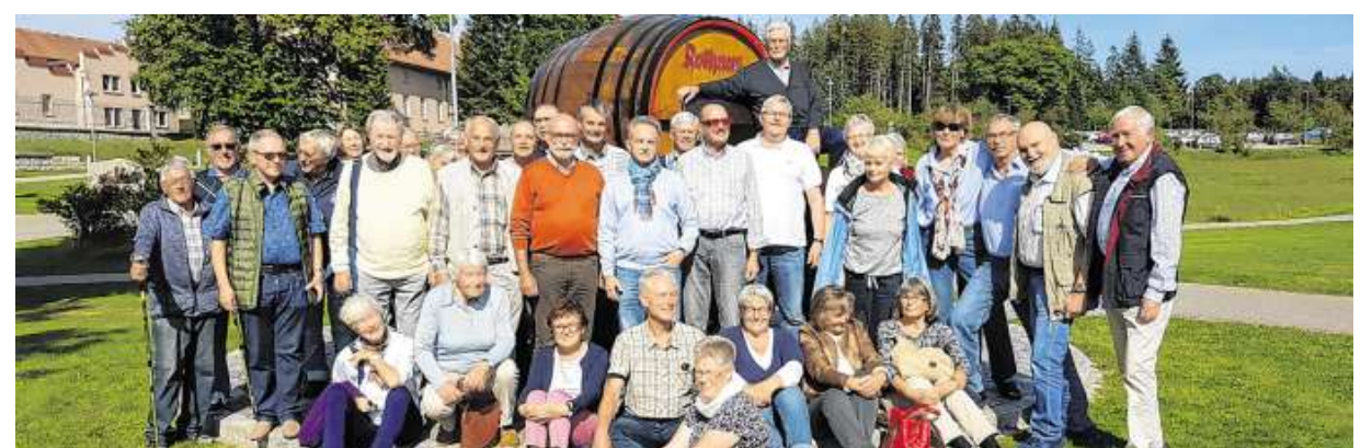
Vor einer historischen Bierkutsche bei der Badischen Staatsbrauerei, wo das berühmte „Tannenzäpfle“ gebraut wird, stellten sich die Ausflügler zu einem Erinnerungsfoto auf.

Weiter ging es in Richtung Freiburg, wo die Sänger in der Nähe Quartier bezogen. Am nächsten Morgen folgte, bei strahlendem Sonnenschein der Höhepunkt der Reise, eine äußerst fundierte Führung durch das Freiburger Münster „Unserer Lieben Frau“. Das Gotteshaus, zunächst im romanischen Stil erbaut, wurde erst in der Spätgotik vollendet. Mit den Liedern „Sanctus“ und „Forschen nach Gott“, beide vom Gründervater aller Männerchöre, Friedrich Silcher, komponiert, bekam der Chor von den rund hundert Kirchenbesuchern anhaltenden Beifall. Bei der anschließenden Wei-