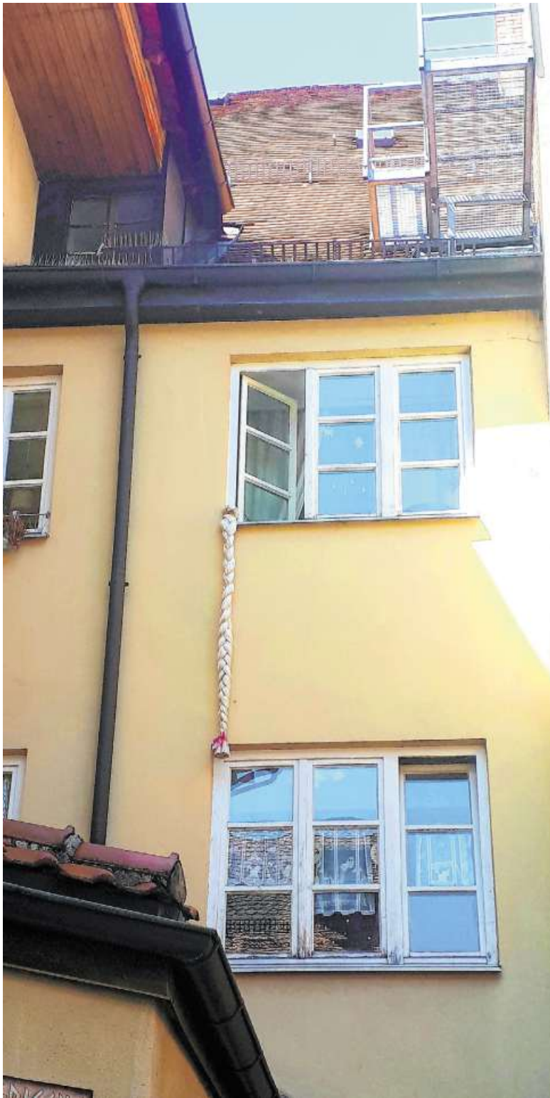
Rapunzel, Rapunzel, lass dein Haar herunter. Wohnt da etwa eine junge Maid, die nach einem Prinzen schmachtet? Vielleicht. Aber nach der Länge des Haarzopfes zu urteilen, will sie nur die Aufmerksamkeit des unter ihr wohnenden Prinzen erregen.