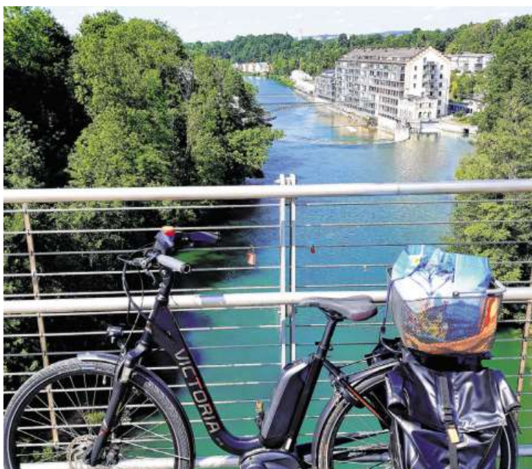
Das Wetter scheint wie gemacht für eine Radtour. Dieses Foto entstand während einer wohlverdienten Pause von der Tour vom Öschle See nach Kempten. Ein gutes Stück Weg. Aber mit diesem E-Rad war die Strecke wohl sehr angenehm.