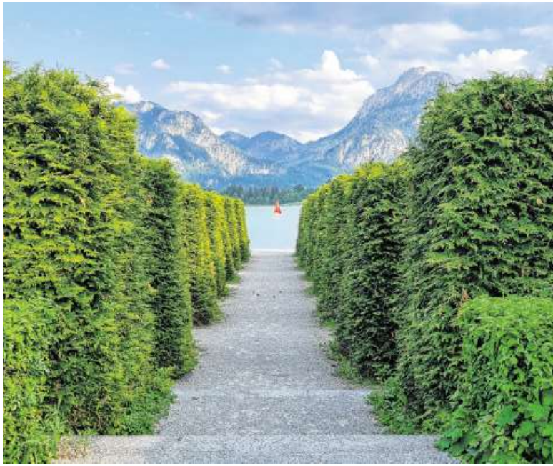
Ein kleiner roter Farblecks in einem größtenteils von grün und blau beherrschten Bild. Die zum See hin kleiner werdenden Hecken, der Weg zum Förgensee und sogar die abfallenden Berge deuten auf ein Boot mit roten Segeln.