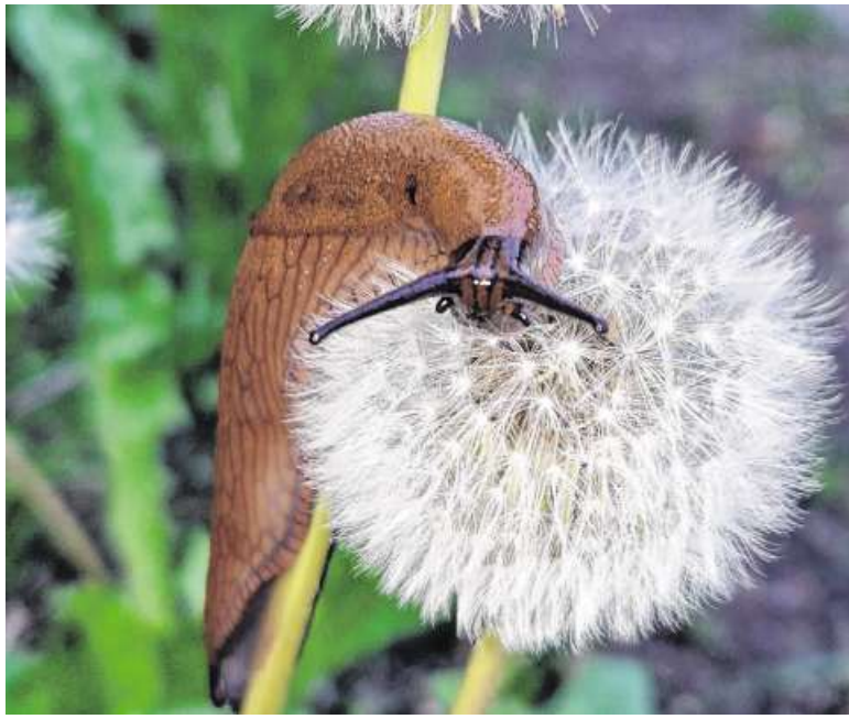
Auf diesem Foto wird eine Pustelblume ganz gründlich von einer Nacktschnecke inspiziert. Es sieht beinahe so aus, als stürze sich die Schnecke köpffüßer in die Blüte, um die kleinen Fallschirmchen aufzuessen. Na, ob das schmeckt?