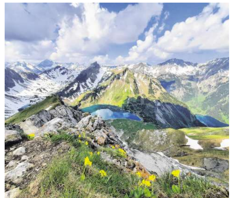
Ein Bild, das die wilde Schönheit der Allgäuer Alpen zeigt. Von der Schöschenspitze fotografiert sieht man die spitzen, noch teils im Schnee legenden Gipfel, die nach oben zulaufenden Berge und die darüberziehenden Wolkenketzen.