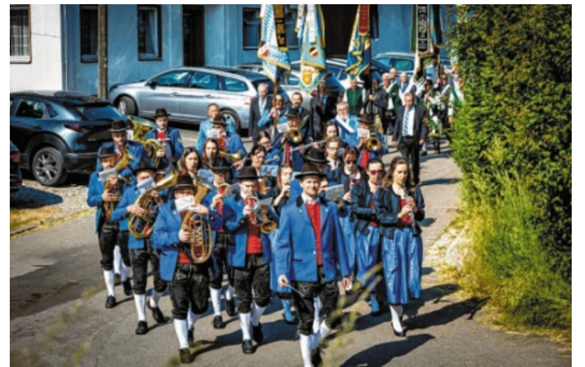
Das Fest begann mit einem Fahnenzug zu der Pfarrkirche Sankt Vitus. Danach ging es ins Festzelt am Dorfplatz.