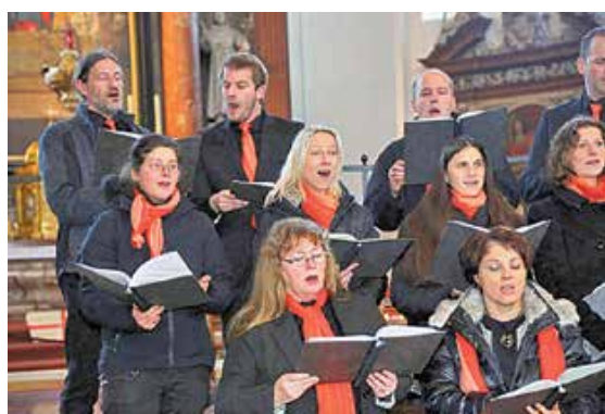
Der Chor96 im Kaisersaal der Abtei Ottobeuren und im Salzer Konzerttätigkeit.

Die aktuellen Auftritte finden Sie auf unserer Website