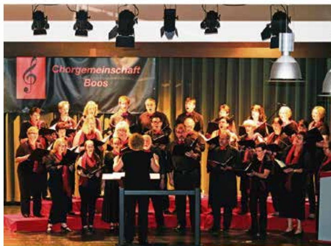
Weitere Informationen und Impressionen finden Sie auf unserer Homepage: http://chorgemeinschaft-boos.de

Auch die Geselligkeit kommt bei uns nicht zu kurz. Grillfeste, Faschingszusammen und Ausflüge führen zusammen. Ein Höhepunkt dabei war sicherlich die Darbietung eines Liedes in der vollen Kathedrale Notre-Dame in Paris. Bei unseren derzeit 22 aktiven Sängerinnen und Sängern sind sowohl Sopran, Alt, Tenor als auch Bass besetzt und somit meist 4-stimmige Chorsätze auf dem Programm. Wer also Lust am Singen hat ist herzlich bei uns willkommen. Wir treffen uns jeden Dienstag um 20 Uhr im Proberaum des Pfarrhauses am Raiffeisenplatz in Boos.