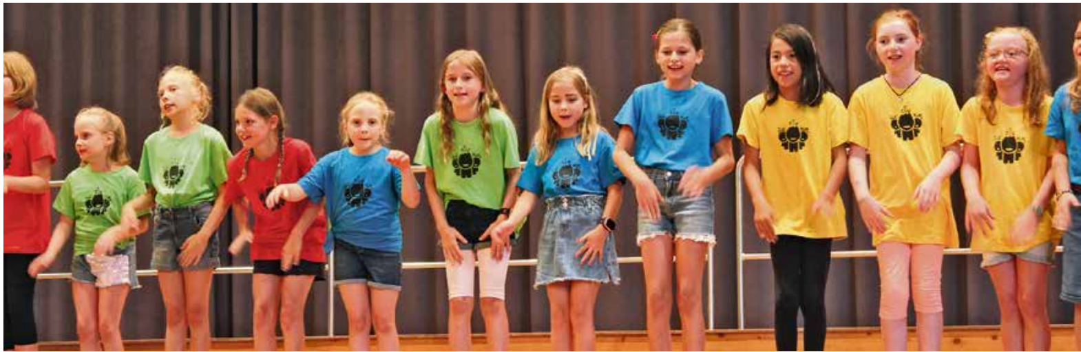
Kinder des Chors „Buki siu Ma Ma“ aus Buxheim beim Kindersingen am 24. 07. 2022.

Bad Grönenbach Kinderchor „Singflöhe“, Kinderchor „Piccolino“, Kinderchor und Jugendchor Cantikids, Bad Wörishofen Jugendchor Kneippspaten, KneippMagers, BENNING Chorgemeinschaft, Buxheim BuKisui MaMa, HardChor, Dietershofen Sunray-Chor Heimertingen Theater- und GSV 1920, Jungen Gennachspaten, Kammlach Kinderchor, Angel Voices, Markt