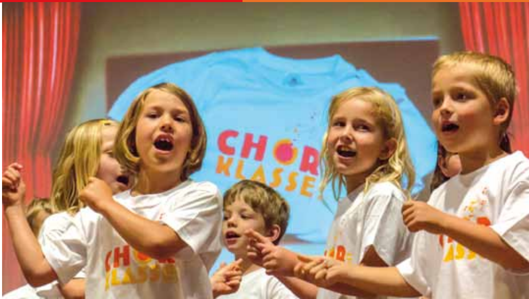
Singbegeisterung pur in Marktoberdorf