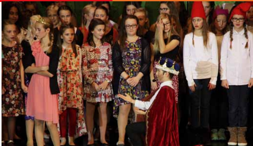
König Laurin und sein Rosengarten: Ein mitreißendes Musical in Dillingen

Ungewöhnliche Klangfarben und Raps ziehen die Zuhörer in ihren Bann. Durch