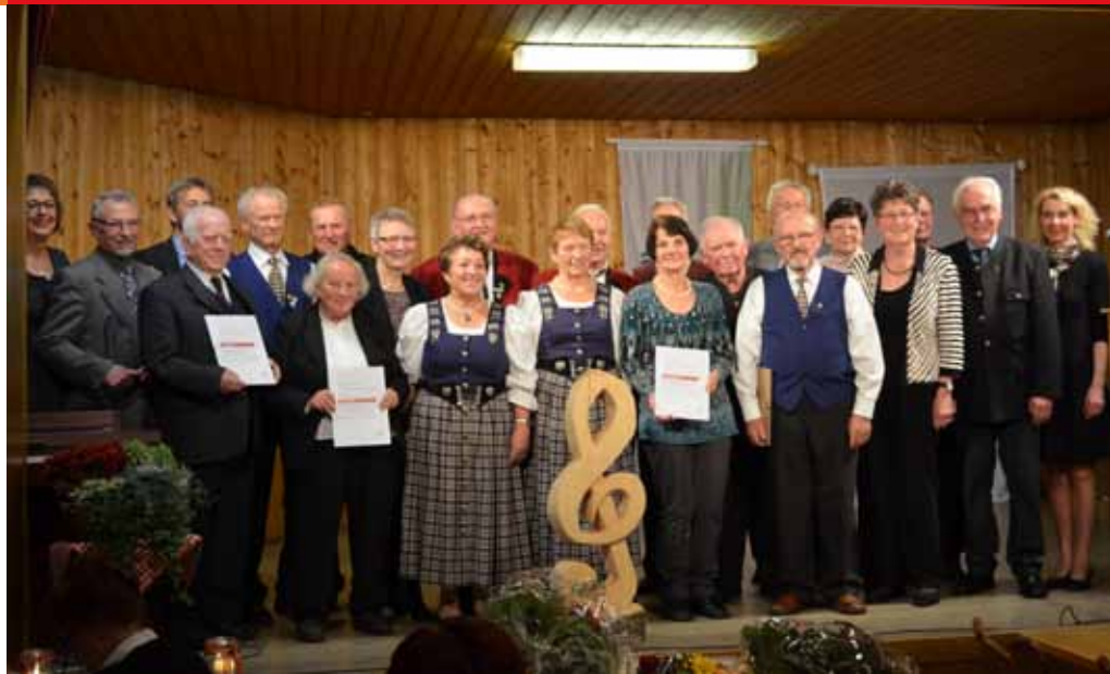
Geehrte Sänger im Iller-Roth-Günz Sängerkreis