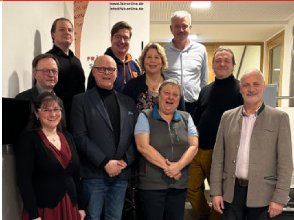
Musikvertreter*innen der bayerischen Chorverbände

Zuletzt verwies der gastgebende Fränkische Sängerbund auf das im Jahr 2025 in Nürnberg stattfindende Deutsche Chorfest. Schon jetzt sind alle bayerischen Chöre und Ensembles aufgerufen, sich hier zu beteiligen.